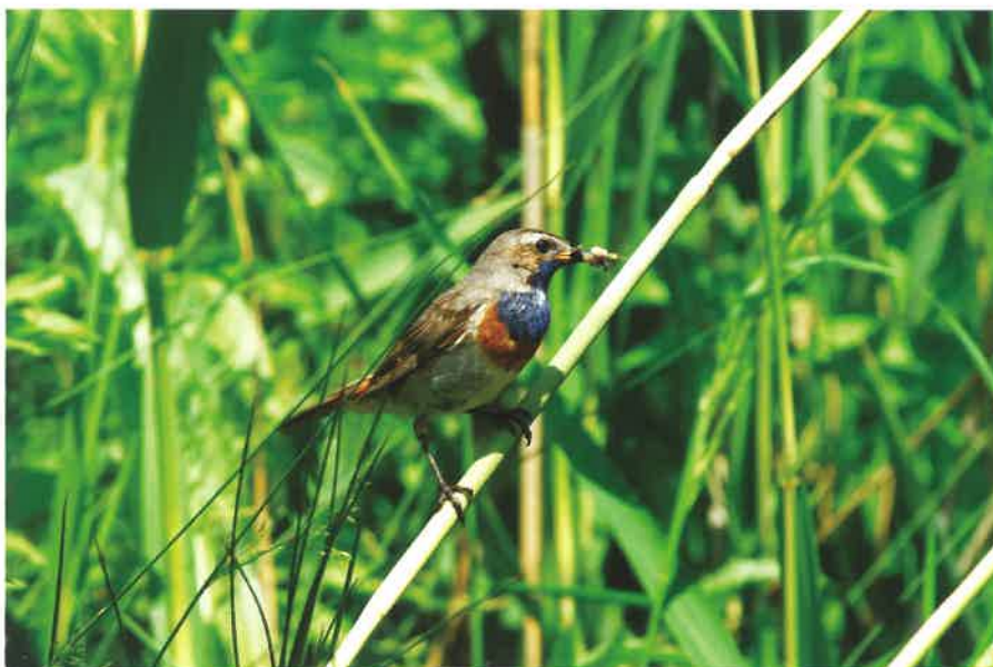
Slavík modráček.

AUTOCENTRUM Jičín Hradecká 1101 506 01 Jičín Tel.: 730 158 502 www.autocentrum-jc.cz