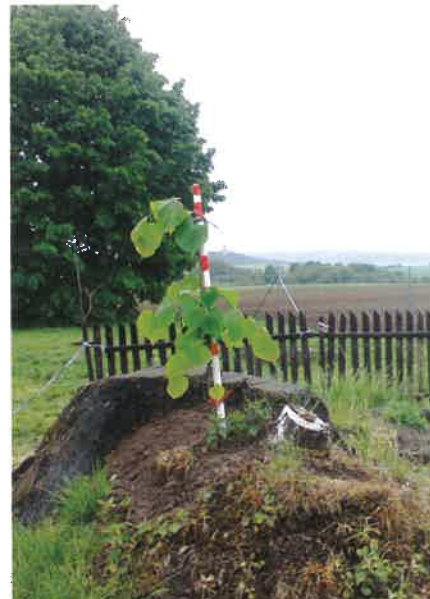
Semtinská lípa a její nástupkyně.